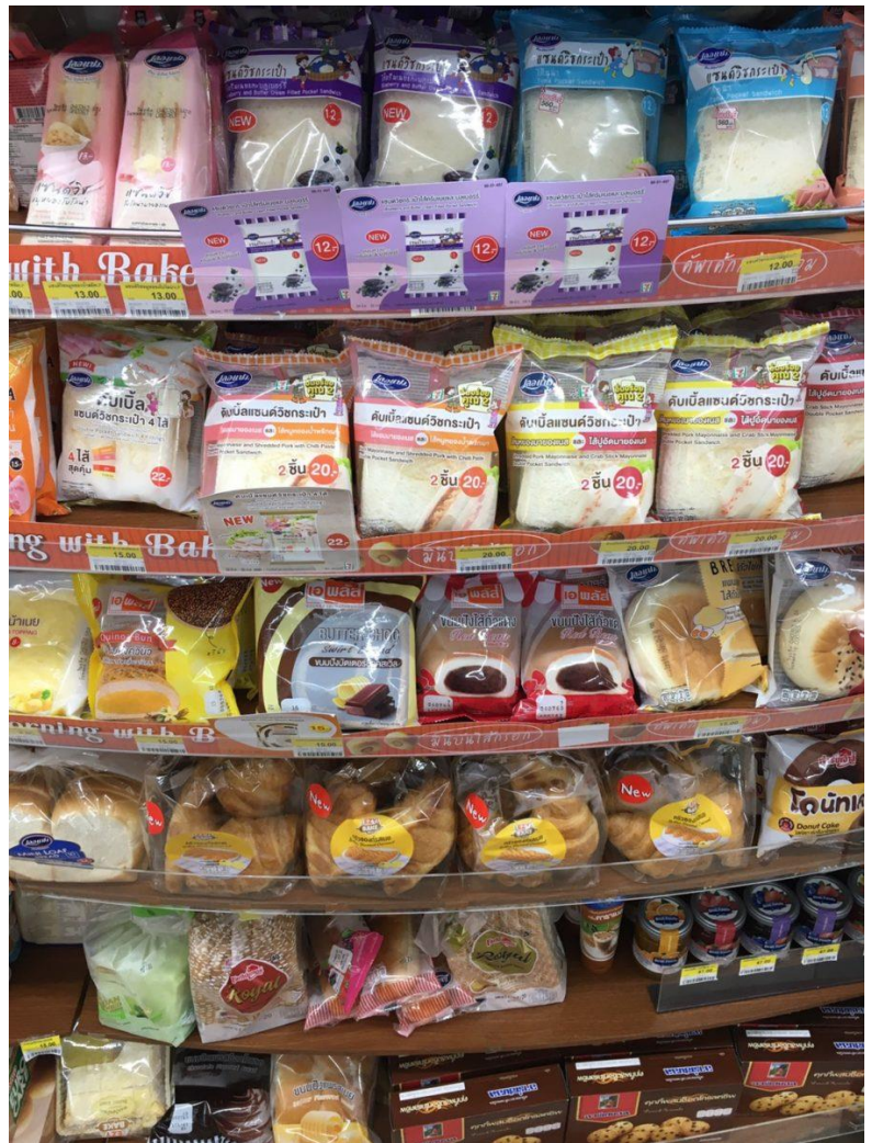
Sandwiches und Konditoreiprodukte gehören zu den beliebten ganztägigen Schnellgerichten. Die Hälfte des Regals wird von CPRAM, einer Tochtergesellschaft von CPALL – dem Betreiber von 7-Eleven – hergestellt.

Tai gehört zur jüngeren Generation, die in der Stadt aufwächst und am liebsten in einem klimatisierten Markt einkauft, wo die rohen Zutaten zum Kochen für ein oder zwei Personen abgepackt werden – Gemüse wird sauber verpackt, Fleisch fein geschnitten oder Fisch filetiert. Wie die Mehrheit der Stadtbewohner*innen kennt sie die Jahreszeiten der Produkte nicht oder weiß nicht, wie sich Dürre oder Überschwemmung auf die Produkte und andere Lebensmittel auswirken würde. Abgesehen von ihrer Lieblingsfrucht, der Durian, die um den April herum erhältlich ist, gibt Tai zu, dass die Jahreszeiten der Produkte oder der Meeresfrüchte außerhalb ihres Wissens liegen.