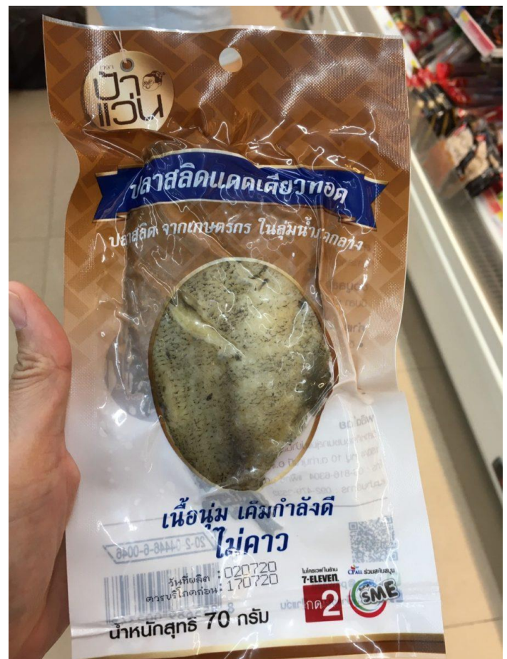
Ein verzehrfertiger, sonnengetrockneter Guramifisch in Vakuumverpackung wird speziell für den Convenience-Store verpackt. Auf der Verpackung befindet sich eine Anweisung: Um den Fisch zu erwärmen, legen Sie die Verpackung in einen Mikrowellenherd bei 7-Eleven und drücken Sie die Taste 2.

„Alles ist für eine Person bestimmt, das ist perfekt für eine Single wie mich“, sagt Tai, die bereit ist, mehr zu bezahlen, damit sie am Ende nicht für den Teil bezahlt, den sie nicht aufessen kann.