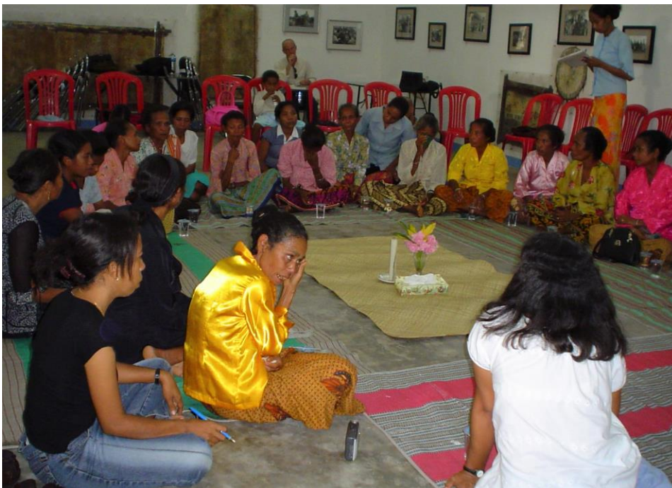
Frauen erhalten Unterstützung vor ihren Aussagen bei öffentlichen Anhörungen der Wahrheitskommission durch die Frauenorganisation Fokupers

Doch sie ist aktiv geblieben. 2015 hat sie die Selbsthilfegruppe Freundschaft unter Witwen gegründet. „Wir müssen nach vorne blicken“, erklärt sie den Mitgliedern, „und das, was in der Vergangenheit war, soll unser Leben nicht mehr bestimmen. Wir müssen den Herausforderungen von heute ohne Angst begegnen.“