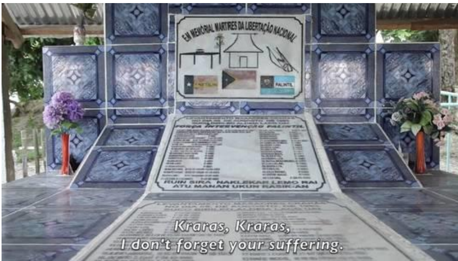
Gedenkstätte für die Opfer des Massakers von Kraras

Anschließend wagte zwar niemand mehr, sie direkt zu beschimpfen, doch die Ausgrenzung von ihr und ihren Kindern blieb bestehen.