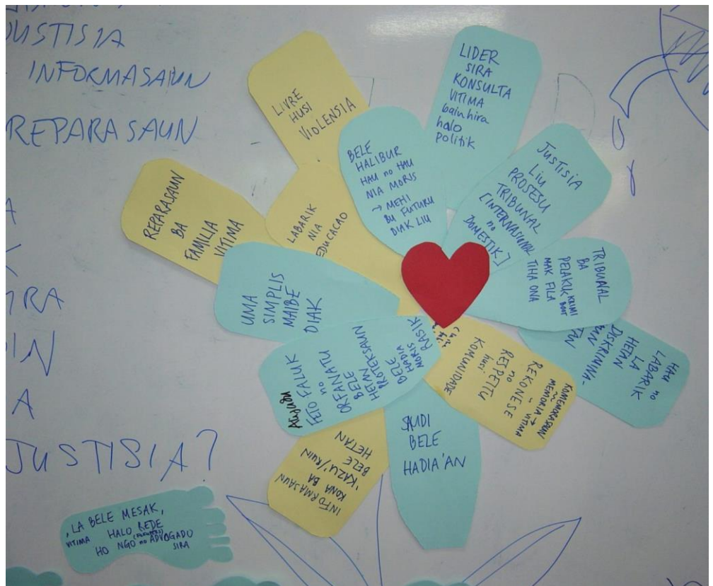
Workshop mit Opfern zur Frage ‚Wie denken Frauen über Gerechtigkeit?‘ bei Fokupers