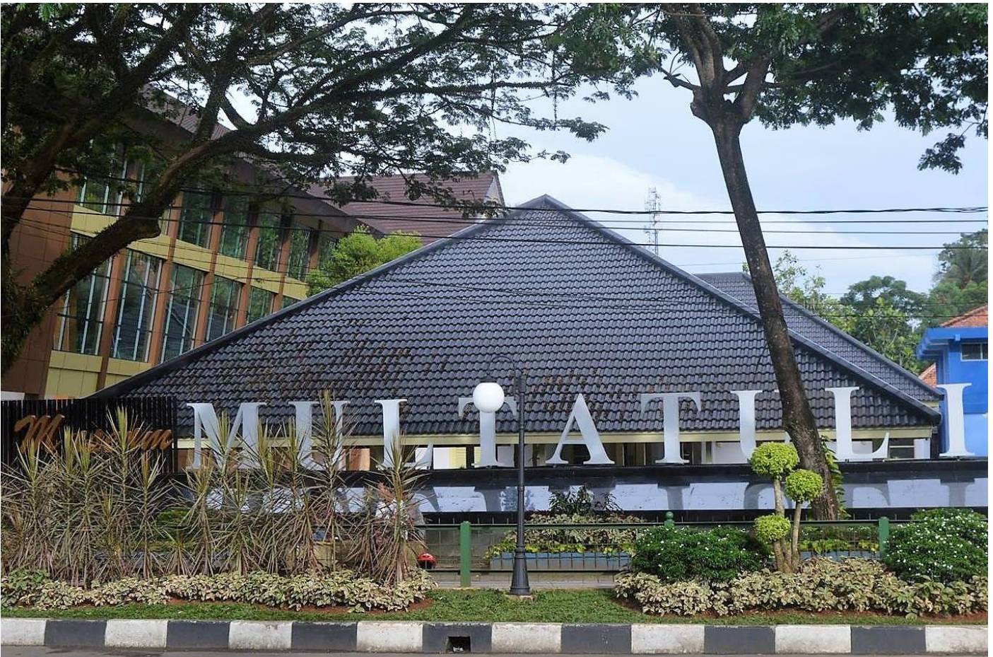
Außenansicht des Museum Multatuli