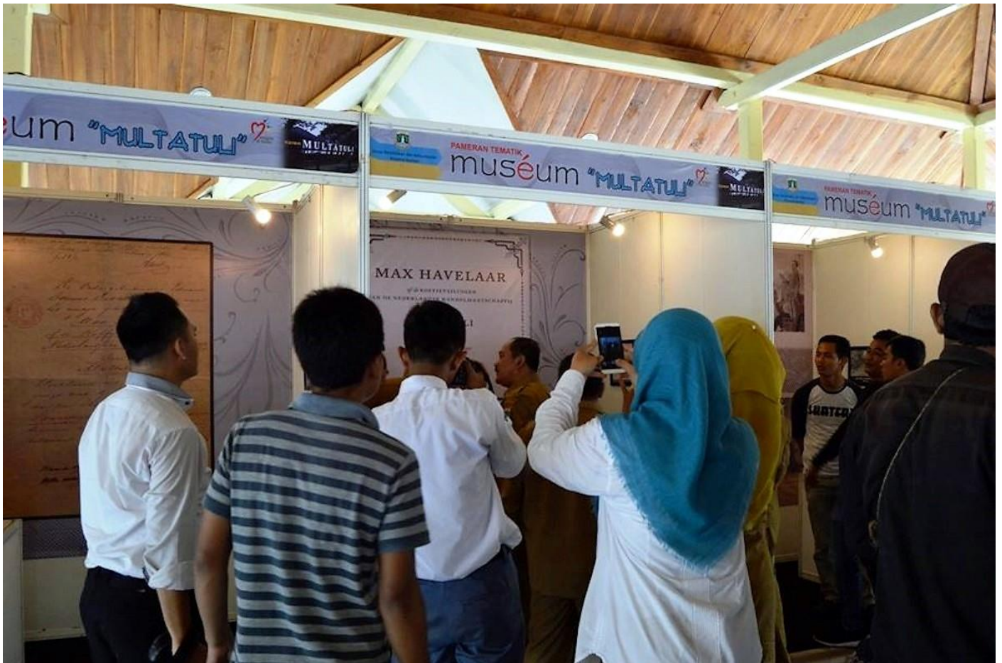
Indonesiens antikoloniales Museum in Rangkasbitung

Indonesien – Die Eröffnung des Multatuli Museums, des ersten ‚antikolonialen‘ Museums Indonesiens unterstreicht die Bedeutung einer kritischen und ganzheitlichen Auseinandersetzung mit der eigenen Geschichte.