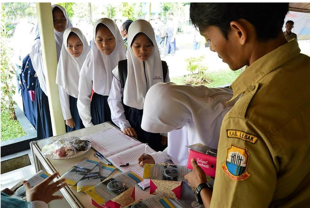
Besuch einer Schüler*innengruppe im Museum Multatuli

Alte Vorstellungen von weißer Überlegenheit, ‚West gegen Ost‘ und ‚Kolonisator*innen gegen Kolonisierte‘ auszuleuchten, ist kein leichtes Unterfangen. „Koloniale Nachwirkungen sind ein Thema mit sehr großer Bandbreite. Es geht darum, die weiße Vormachtstellung zu kritisieren, die die diskriminierende Politik der niederländischen Ostindien-Ära hinterlassen hat, aber nicht nur darum“, sagte die indonesische Forscherin Eunike G. Setiadarma und fügte hinzu, dass auch die rassistische Diskriminierung zwischen lokalen Ethnien in Indonesien auf die Politik und Denkweise zurückgeführt werden kann, die während der Kolonialzeit ‚eingimpft‘ wurden