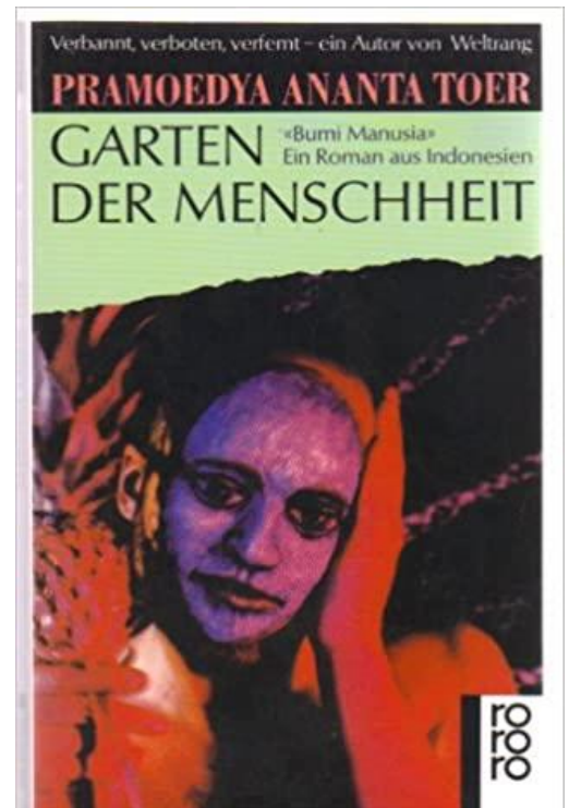
Die Buru-Tetraologie besteht aus den vier Büchern Bumi Manusia ( Garten der Menschheit ), Anak Semua Bangsa ( Kind aller Völker ), Jejak Langkah ( Spur der Schritte ) und Rumah Kaca ( Haus aus Glas ). Die Bücher des Autors Pramoedya Ananta Toer wurden während de

Ganz anders als die Darstellung von Minke im Film Bumi Manusia ist der Minke im Buch: eine Figur, die sich ihrer Herkunft stets bewusst ist und feste Meinungen und Haltungen vertritt. Gleichzeitig hat er auch Züge eines jungen Menschen, der seinen Lehrer an der HBS idealisiert. So ist Minke im Buch fasziniert von der Moderne, erlebt aber auch deren Mängel. Diese Dualität der Gefühle kommt im Film nicht ausreichend zum Ausdruck.