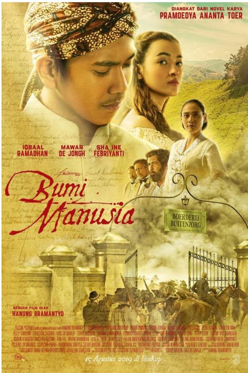
Filmplakat Bumi Manusia