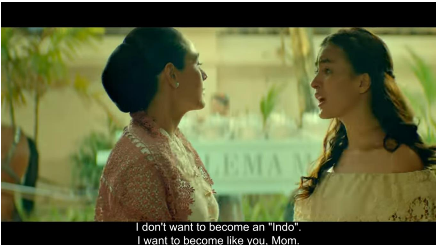
Annelies (rechts) und ihre Mutter Sanikem/Nyai Ontosoroh

Als der Film anlief, fanden die meisten Zuschauer*innen, dass er gelungen sei: mit guten Bildern und berührenden Geschichten über die Vergangenheit Indonesiens, die auch einen Hauch von Nationalismus erkennen ließen. Der Film beginnt mit einer Szene, in der Robert Suurhof, ein indo-europäischer Kommilitone aus der HBS, Minke begeistert einlädt, der Amtseinführung von Königin Wilhelmina beizuwohnen. Diese Eröffnung ist wichtig, weil die indonesischen Zuschauer bei dieser symbolischen Gelegenheit zwei Männer zu sehen bekommen, einen Indo-Europäer und einen Pribumi [Einheimischer], die in der Kolonialzeit fließend Niederländisch miteinander sprechen.