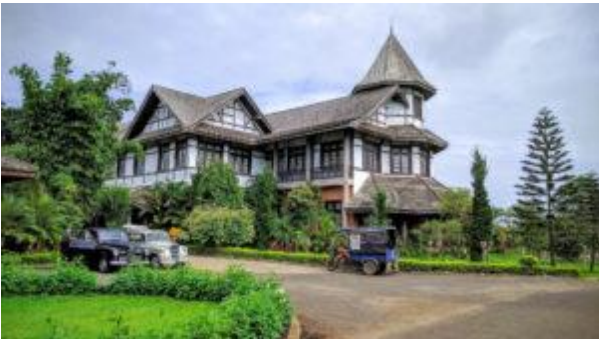
Sommerpalast des Gouverneurs des britisch besetzten Burmas in Pyin Oo Lwin: Ungefähr so, nur etwas kleiner, hätte wohl der European Club in Tage in Burma ausgesehen haben können.

In Tage in Burma erzählt Orwell die Geschichte von John Flory, einem circa 35-jährigen Engländer, der Holzhändler ist und seit über 15 Jahren in Burma lebt. Flory leidet unter Einsamkeit und unter dem Leben als weißer Mann in Burma. Für ihn ist die Stadt Kyauktada mit ihren kolonialen Strukturen ein ambivalenter Ort. Im Gegensatz zu den anderen Engländer*innen stellt er die Anwesenheit der Briten in Burma in Frage und fühlt sich gefangen in dem engen sozialen Gefüge der Europäer*innen, das geprägt ist von rassistischen Wertevorstellungen und gesellschaftlichen Erwartungen. Als einer von Wenigen pflegt er eine Freundschaft mit einem ‚Orientalen‘, dem indischen Dr. Veraswami. Mit ihm spricht er offen über seine kritischen Ansichten. Das auch mit anderen Menschen zu tun, dazu fühlt er sich allerdings nicht in der Lage.