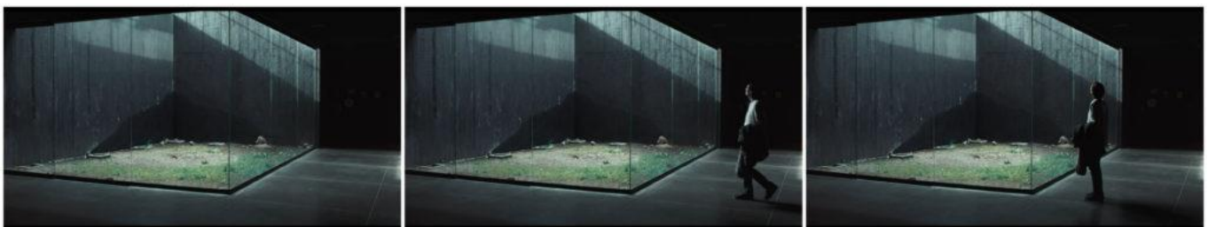
Der thailändische Künstler Apichatpong Weerasethakul meditiert in seinem Film Memoria auf beeindruckende und verstörende Weise über Erinnerung.

Jessica (Tilda Swinton) wird eines Nachts von einem lauten Klang, den kein anderer hört, aufgeweckt. Der Klang, wie ein fernes Echo der Erinnerung, verfolgt die Schottin, die in Kolumbien ihre kranke Schwester besucht. Während die Schwester anscheinend in Vergesslichkeit sinkt, erinnert sich Jessica an Ereignisse, die nicht ihr passierten. Die Reise um die Quelle des nächtlichen Klangs zu finden führt sie in die Tiefe des Landes. Ihr 'Guide' ist Hernan, ein Mann, den nur sie sehen kann. In seiner ersten Manifestation hilft Hernan in Gestalt eines Jungen, den Klang für Jessica zu rekonstruieren. Eine merkwürdige Annäherung und Kameradschaft entwickeln sich zwischen den beiden, aber kurz darauf verschwindet er, als hätte er nie existiert. Währenddessen wird der Klang im Kopf von Jessica immer stärker und häufiger, andeutend dass sie näher an ein Verständnis ihren akustischen Halluzinationen kommt.