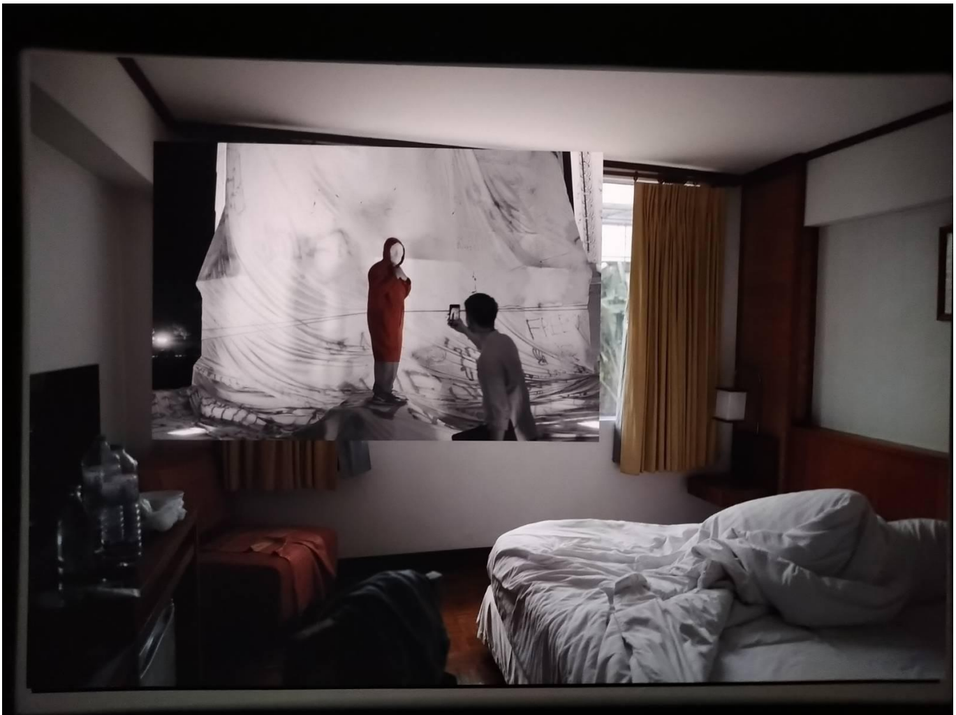
A Minor History Part 2: Beautiful Things von Apichatpong Weerasethakul, Ausstellung in der 100 Tonson Foundation, Bangkok (18.2.2022 – 10.4.2022).

Thailand/Kolumbien: Seit Mai 2022 läuft der Film "Memoria" des thailändischen Künstlers Apichatpong Weerasethakul in deutschen Kinos. "Memoria" ist eine Meditation über Erinnerung mit Hilfe aller Sinne. Die Ausstellung "A minor history" in Bangkok dokumentiert die Entstehung des Films.