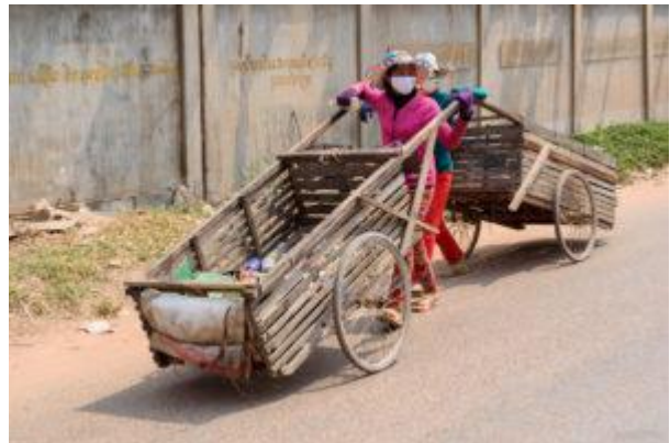
Viele Menschen verdienen ihren Lebensunterhalt mit dem Sammeln von Plastik- und Metallabfällen und dem anschließenden Verkauf der Materialien.

Es gibt immer Hindernisse in verschiedenen Systemen und Konstellationen. Regionen wie Kambodscha sind in ungleicher Weise vom Klimawandel betroffen. Ich musste auf meiner Reise lernen, dass, wenn man die Menschen belehrt, herausfordert oder negativ provoziert, man selten sein Ziel erreicht. Also muss man verstehen, wo die Menschen herkommen, alle potenziellen Urteile beiseite legen und mit den Leuten zusammen zu arbeiten. Mit Empowerment von Engagierten lernen wir gemeinsam, welche Schritte wir unternehmen können, um Probleme zu lösen. Wir lernen, wie wir es auf eine positive, proaktive, ergebnisorientierte Art und Weise angehen können. Es braucht ein wenig Zeit, aber mit gutem Beispiel voranzugehen ist für die Herbeiführung von Veränderungen am wirksamsten.