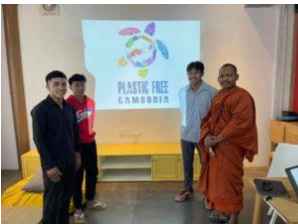
Die Vision von Plastic Free Cambodia ist es, Kambodscha so plastikfrei wie möglich zu machen.