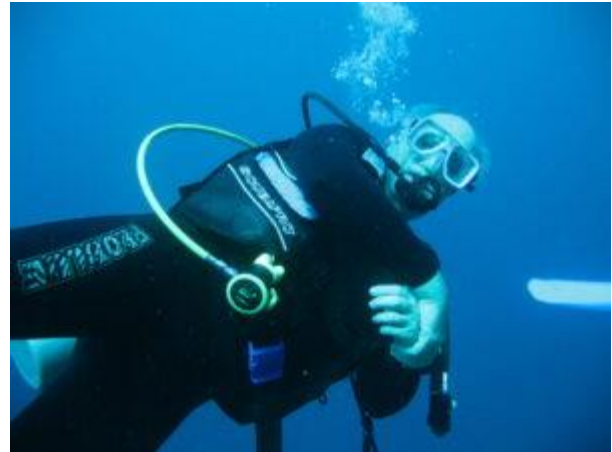
Der Autor unter Wasser.

Wir lassen uns auf 14 Meter sinken, auf ein kleines Unterwasser-Plateau. An der Seite geht es noch einmal über 20 Meter weiter in die Tiefe. Auf einem schmalen Absatz, der einem Unterwasser-Balkon gleicht, knien wir nieder und halten uns an dort verankerten Leinen fest. Das Wasser ist dämmrig blau-grau, hier unten gibt es kaum noch Farben. Wir blicken in die Tiefe. Und dann sind sie plötzlich da, die majestätisch-souveränen, bizarren Fuchshaie. Erst einer, dann zwei, schließlich ein Dritter tauchen sie aus der bodenlosen Tiefe auf, ihre Körper vielleicht zwei Meter lang, der schräg nach oben gerichtete obere Teil der Schwanzflosse noch einmal fast ebenso lang. An ihnen, um sie herum machen sich Putzerfische zu schaffen. Gemächlich ziehen die Haie vor uns ihre Kreise. Versunken in den Anblick vergesse ich die Zeit.