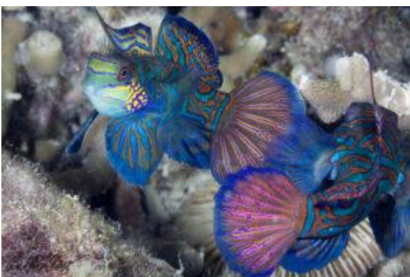
Mandarinfische bei Malapascua.

Die Philippinen liegen im Coral Triangle , dem Weltzentrum der marinen Biodiversität. Hier findet man knapp 600 von insgesamt 800 Riffbildenden Korallen. Zum Vergleich: das australische Great Barrier Reef weist nur knapp 400 Arten auf und liegt damit auf der Biodiversitätsskala an dritter Stelle (Jürgen Freund, Hg.; Sulu-Sulawesi-Seas; Manila 2001). In den philippinischen Wassern findet man 33 Mangrovenarten, 800 Algenarten, mehr als 1.200 Arten von Riffischen, 22 Wal- und Delfinarten. Außerdem leben hier Seekühe ( Dugong ) und Walhaie, die größten Fische der Welt.