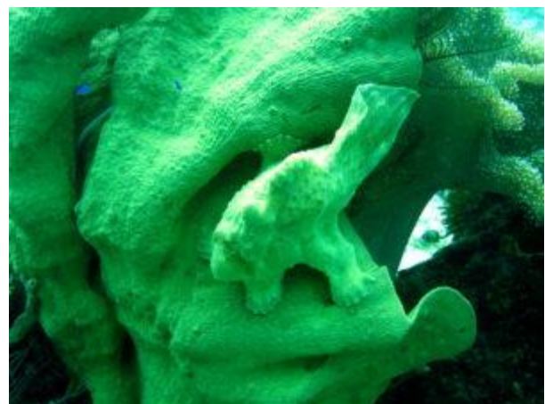
Vom Autor aufgenommener Anglerfisch © Christoph Dehn

Das Tourismusministerium misst dem Tauchtourismus große Bedeutung und ein starkes Wachstumspotenzial zu. Das Ministerium schätzt, dass etwa fünf Prozent der ausländischen Tourist*innen Freizeittau-cher*innen sind. Das Einkommen aus Tauchtourismus weltweit wurde für 2022 mit knapp vier Milliarden US-Dollar angegeben. Zahlen für die Philippinen sind nicht bekannt. Man geht aber davon aus, dass Tauchtourist*innen über eine höhere Bildung und ein größeres Einkommen verfügen, mehr Nächte im Land verbringen und pro Tag mehr ausgeben als der Durchschnitt der Tourist*innen. Hinzu kommt eine stark wachsende Zahl einheimischer Taucher*innen.