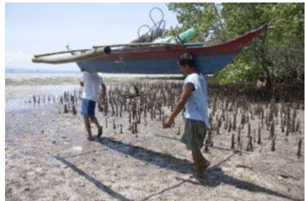
Fischer auf dem Weg zum küstennahen Fischfang

In einer Situation abnehmender Fischbestände greifen Fischer*innen immer häufiger zu destruktiven Methoden. Ich kann mich an keinen einzigen Tauchgang vor der Insel Cebu erinnern, bei dem ich keine Unterwasserexplosion gehört hätte. Dynamit-Fischen ist eine Fischereimethode der Verzweiflung. Dabei werden meist aus Glasflaschen und Sprengstoff selbstgebaute Granaten im Wasser zur Explosion gebracht. Die Druckwelle zerstört die Schwimmblasen der Fische und tötet oder betäubt sie. Diese Methode ist höchst ineffizient, weil von 10 getöteten Fischen nur einer oder zwei an die Oberfläche treiben und eingesammelt werden können, der Rest sinkt zu Boden. Zugleich wird alles Meeresleben im Umkreis geschädigt oder zerstört. Schätzungen gehen davon aus, dass etwa 70.000 der einen Million Kleinfischer*innen in den Philippinen mit Hilfe von Sprengladungen fischen .