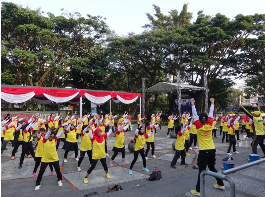
Im Vorfeld der Wahlen 2024 wird darüber diskutiert, ob künftig ein Verbot von Wahlkampfkampagnen sowie Werbematerialien politischer Parteien oder gar ein Verbot aller 'politischen Aktivitäten' bei Car Free Days gelten soll.