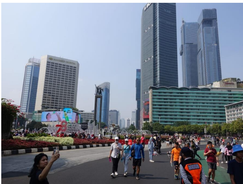
Und nicht vergessen: Selfies...