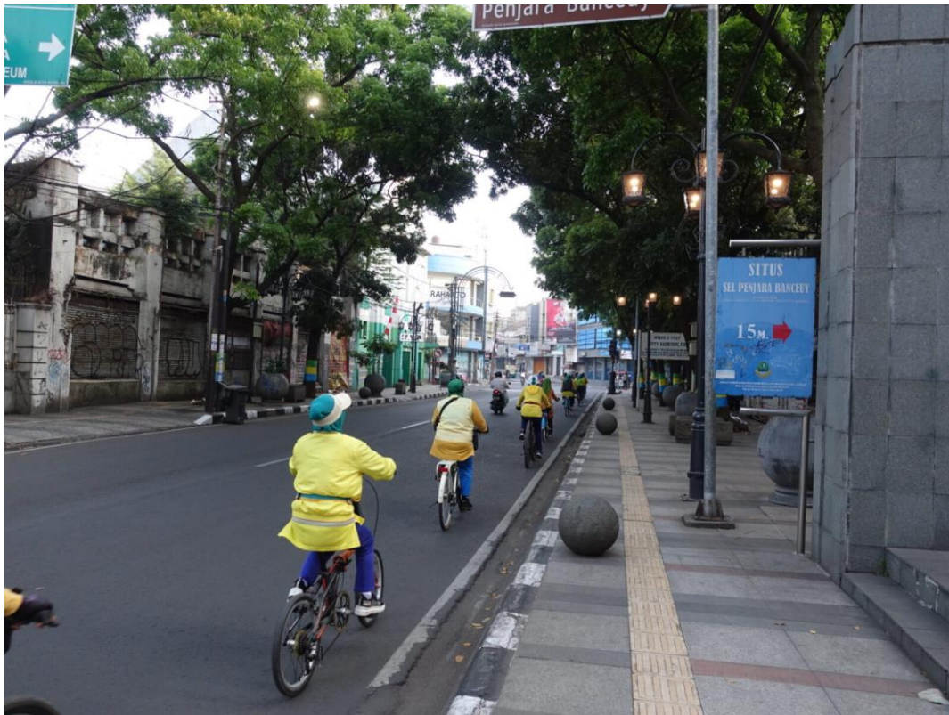
Car Free Days gibt es mittlerweile in vielen Städten Indonesiens, wie hier in Bandung. Viele Gruppen kommen dann mit eigenen Uniformen.