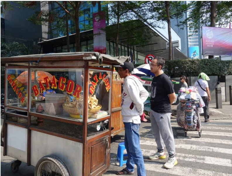
... auch für die zahlreichen Straßenhändler*innen ist es ein guter Tag...