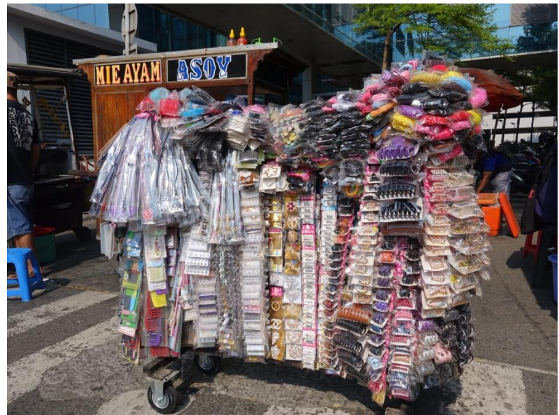
... praktisch alle Dinge des täglichen Bedarfs, werden auf der Straße angeboten...