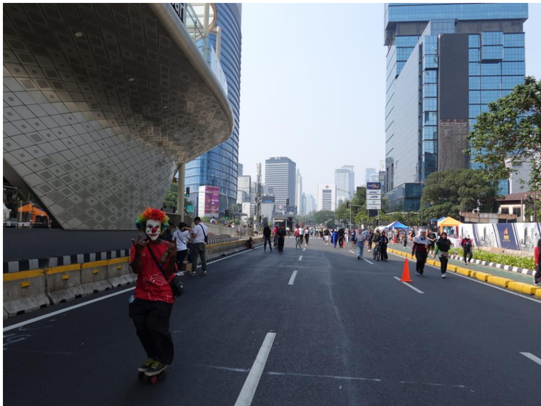
Einige Menschen entwerfen ihre eigene Kostüme und treten als Superhelden oder als Clowns auf...