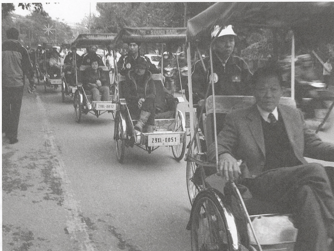
Chinesische Kolonne durch Hanoi