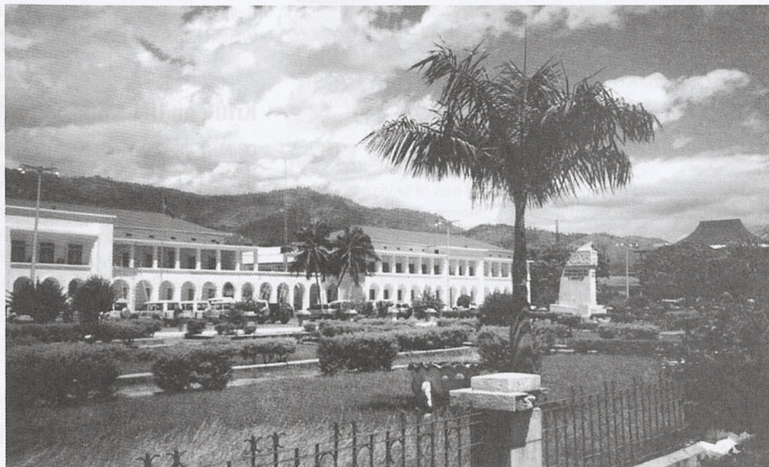
Der Regierungssitz in Dili