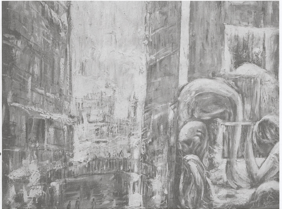
Bild von Myint Swe aus der Berliner Kunstausstellung der Heinrich-Böll-Stiftung (S. 18)

Straßenecke einen Bankautomaten zu finden und in jedem noch so kleinen Laden mit Kreditkarte zahlen können. Diese kritische Ressource, Sinnbild für Ungleichheit und Überlebenskampf in einem Land, in dem die eigene Währung Kyat in abergläubisch-astrologisch adäquaten Banknotengrößen inkonvertibles Spielgeld bleibt und nach globalen Gütern (Auf)Strebende einer Währung nachjagen, in deren Besitz sie nur zu astronomischen Schwarzmarktraten verbotenerweise gelangen. Einer Währung, die nur der korruptklientelistischen Elite vorbehalten bleibt, die Burmas Parallelwirtschaft und Geldwäsche kontrolliert und in schicken, vollklimatisierten Einkaufszentren zu teuren Preisen einkauft, fernab von fehlendem Strom und unsicherem Auskommen.