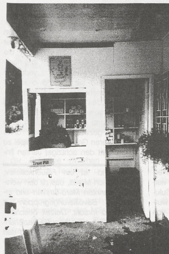
Ein Gesundheitsladen des Famus-Projekts