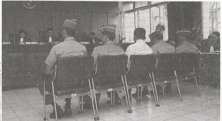
aus: FEER v. 11.4.2002, S. 19

Die Autorin ist Politologin, Mitglied von Watch Indonesia! und promoviert zum Thema Vergangenheitsaufarbeitung.