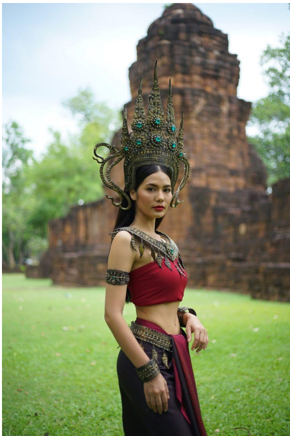
Screenshot Sap Krasue (Ch. 8, 2018): Verortung des Ursprungs in der Khmer Kultur Angkors – die erste Trägerin des Fluchs wird in der aktuellen Soap Sap Krasue als Apsara dargestellt, Quelle: https://drama.kapook.com/view199555.html

Wie der gleichnamige Film, erzählt Krasue Sao die Geschichte der jungen Buaklee, die von ihrer Großmutter aufgezogen wird. Diese hinterlässt Buaklee auf dem Totenbett einen Ring unter der