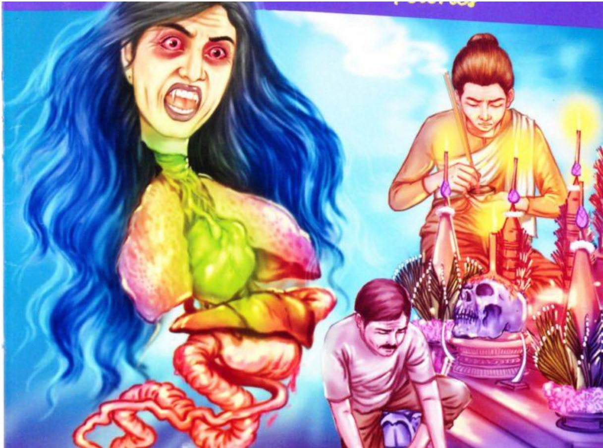
Darstellung des Khmer Äquivalents Phi Krasues in einem kambodschanischen Comic