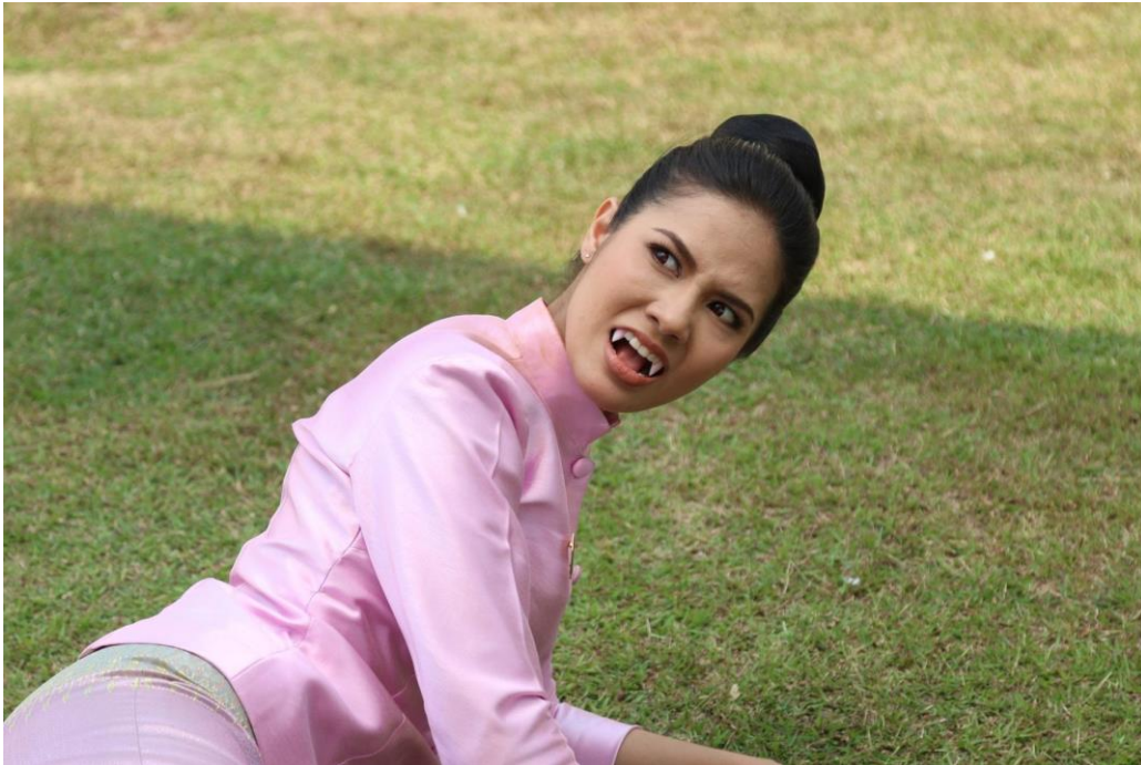
Betonung vampirartiger Züge in der gegenwärtigen Darstellung Phi Krasues in der Daily Soap Sap Krasue (Ch. 8, 2018)

das populäre Bild hexenartiger Wesen so nachhaltig beeinflusst, dass es sich heute auch in Kambodscha findet.