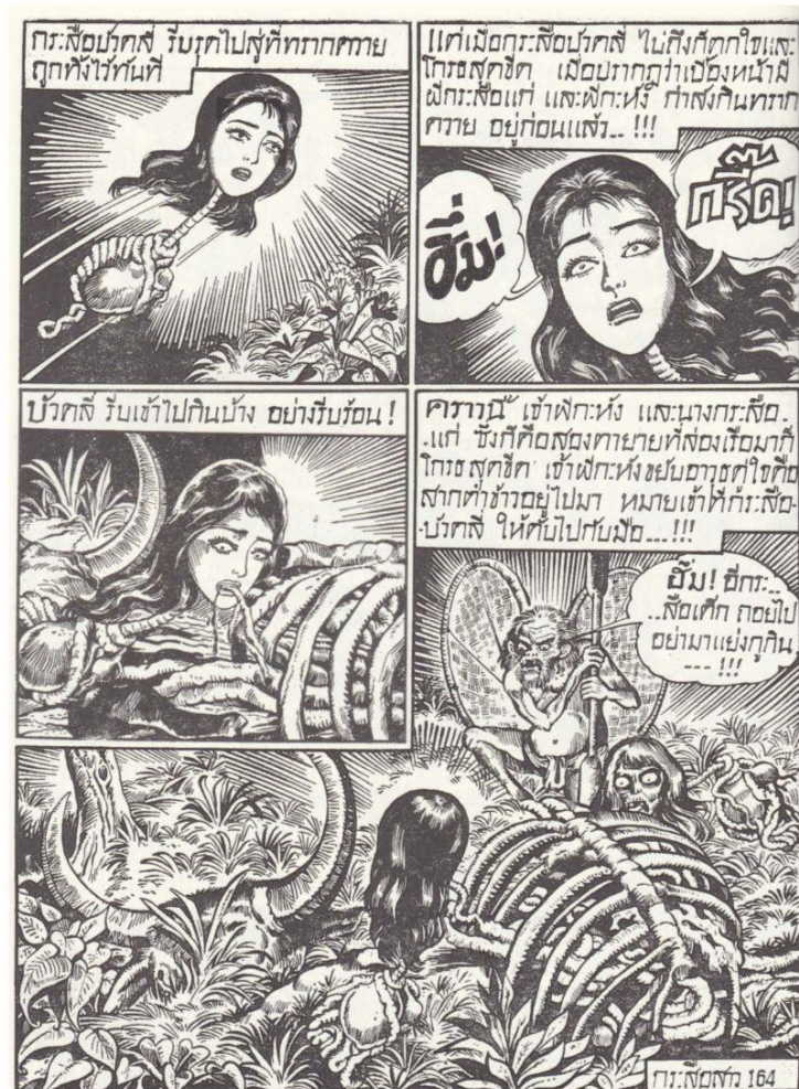
Darstellungen Phi Krasues und Phi Krahangs im Comic Krasue Sao © Tawe Witsanukorn

etliche andere Wesen der thailändischen Folklore erstmalig in bildlicher Darstellung. Dazu zählt auch Phi Krahang , der als männliches Äquivalent Phi Krasues betrachtet wird. Auch hier scheint Tawees Comic eine Schlüsselrolle gespielt zu haben, was Phi Krahangs Erscheinungsbild nahelegt, das sich augenscheinlich von dem Phi Krasues unterscheidet. Phi Krahang wird gewöhnlich als menschliches Wesen mit Tierschwanz imaginiert, das zwei Worfelkörbe als Flügel nutzt und auf einer Mörserkeule durch die Luft reitet. Im Gegensatz zu Phi Krasue ruft Phi Krahang meist kein unheimliches Gefühl hervor, sondern wird eher mit Schmunzeln betrachtet.